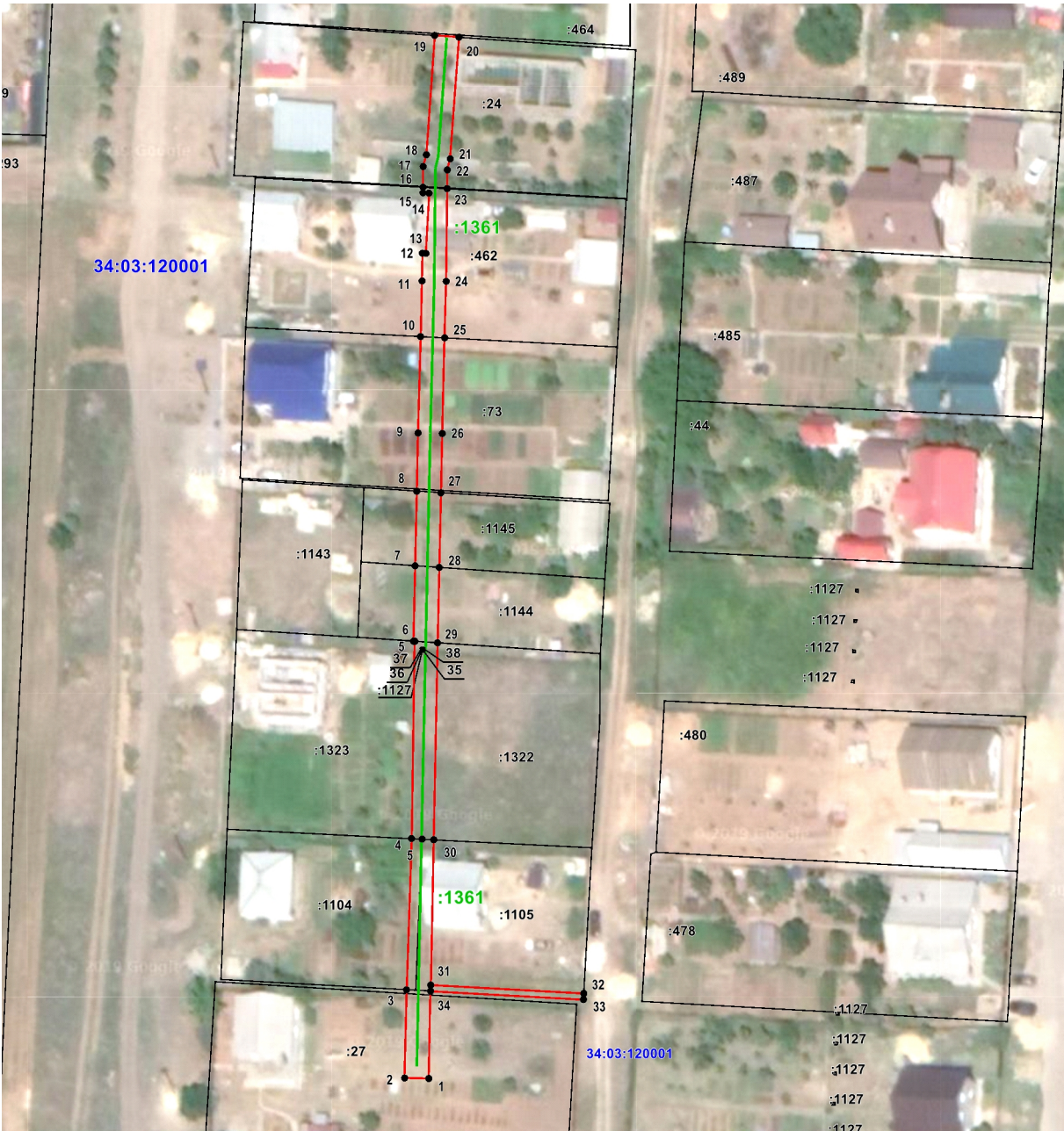
Масштаб 1:1 100