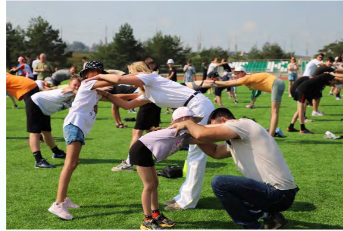
Общенациональная патриотическая зарядка «МЫ РОССИЯ»