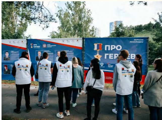
Интерактивная выставка «Про Героев»