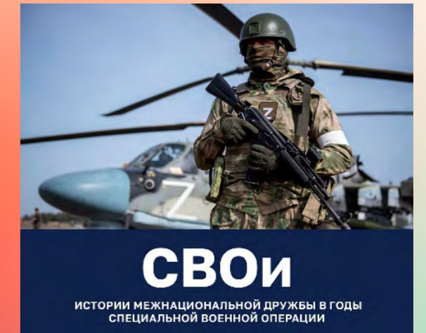
«СВОи» - истории межнациональной дружбы в период специальной военной операции на Украине