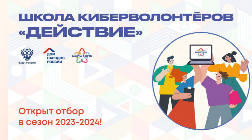
Образовательный проект «Киберволонтеры «Действие»