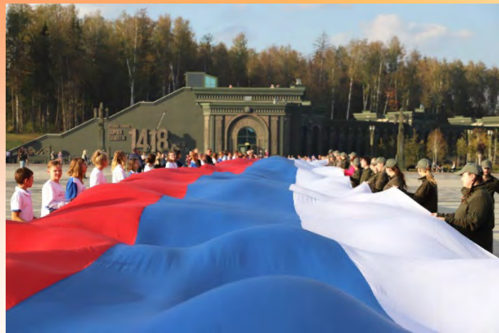
Выездная культурно-гуманитарная акция «Народы вместе сквозь года»