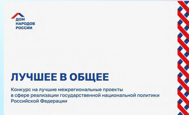
Конкурс «Лучшее в общем»