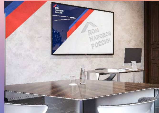
Лекторий «Россия – Дом народов»