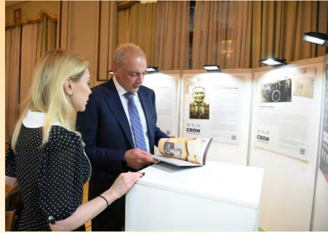
«СВОИ» - истории межнациональной дружбы в годы Великой Отечественной войны